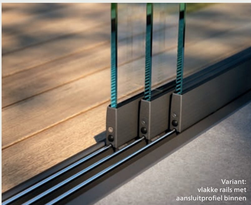
Variant: vlakke rails met aansluitprofiel binnen

Voor een mooie overgang tussen rails en uw vloer op het terras zorgen de elegante vloeraansluitprofielen, passend bij ieder type vloer.