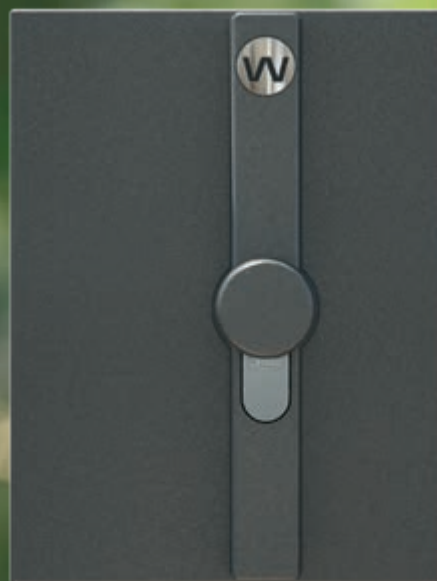
Cilinderslot aanzicht van binnen