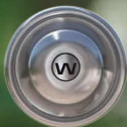
Schelpgreep rond RVS